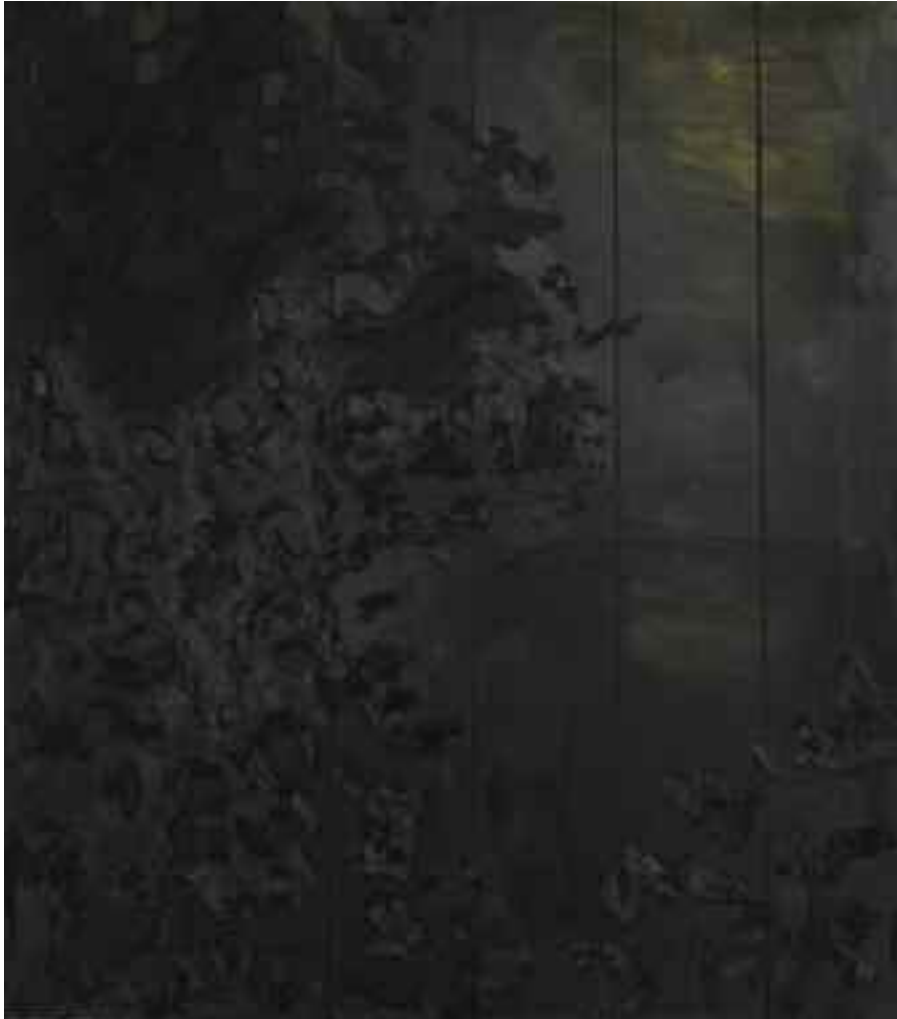
Ladans port, natt/Barn Door, night