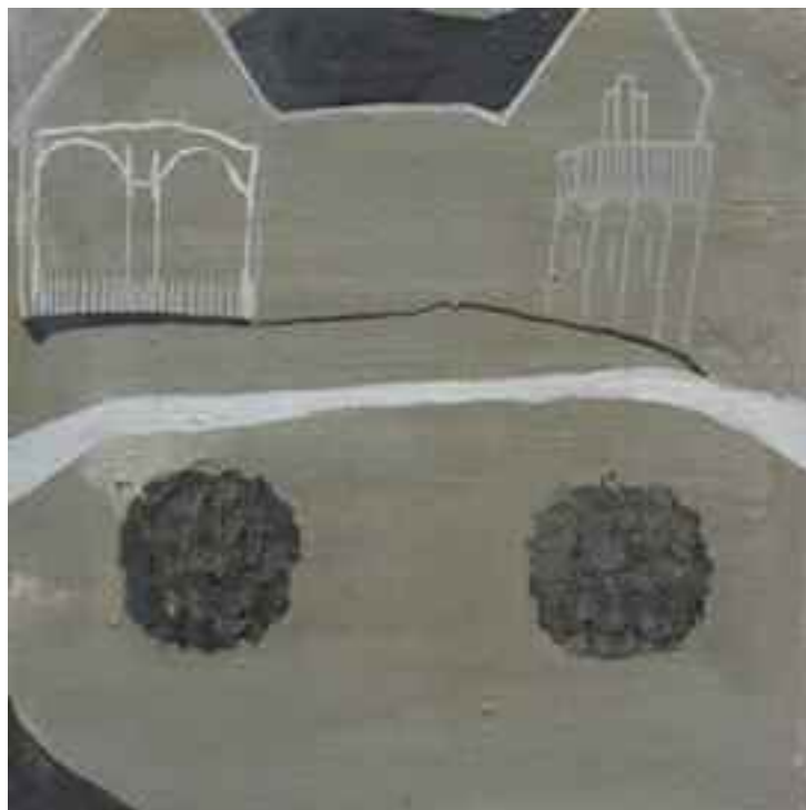
Skivarp I 30x30, olja 2007