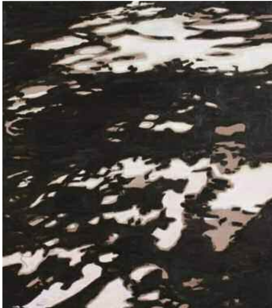
Under eken/ Under the Oak Tree