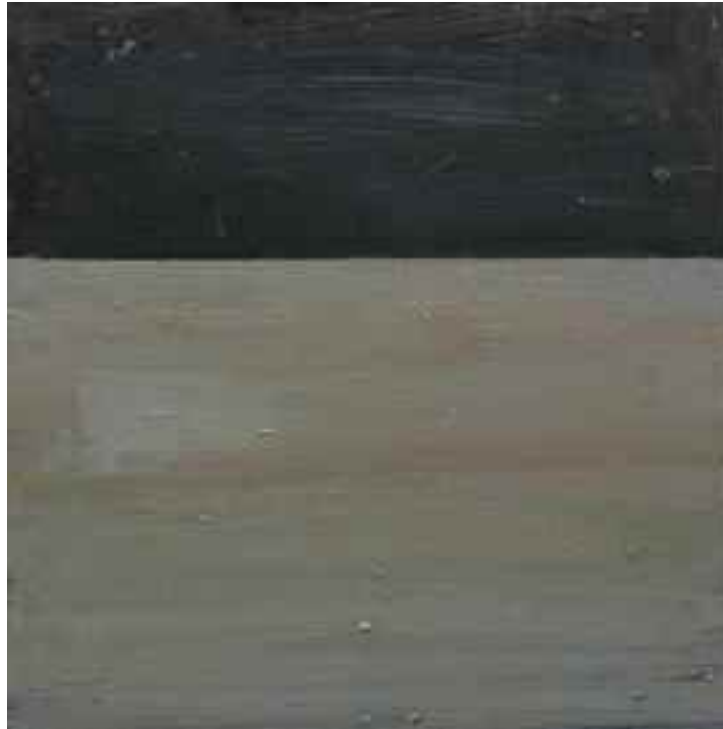
Östersjön/The Baltic Sea 30x30, olja 2007