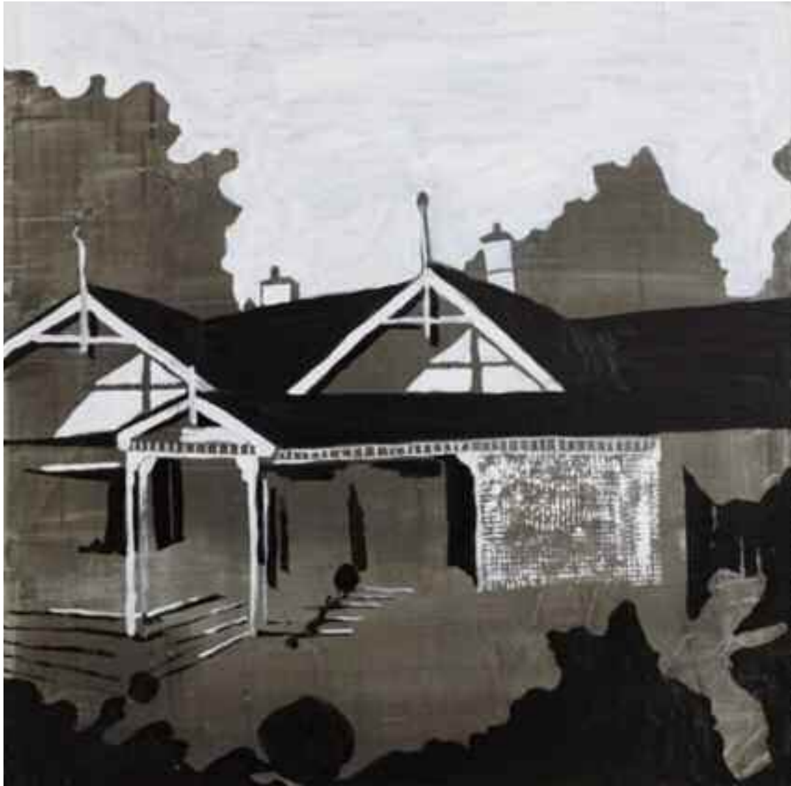
Dogwood II 43x43, olja 2008