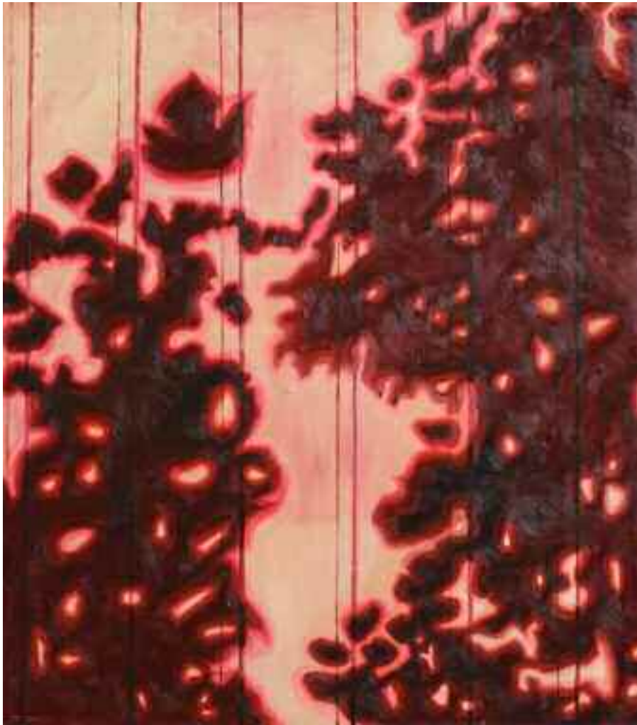
Mot ladans vägg/Against the Barn