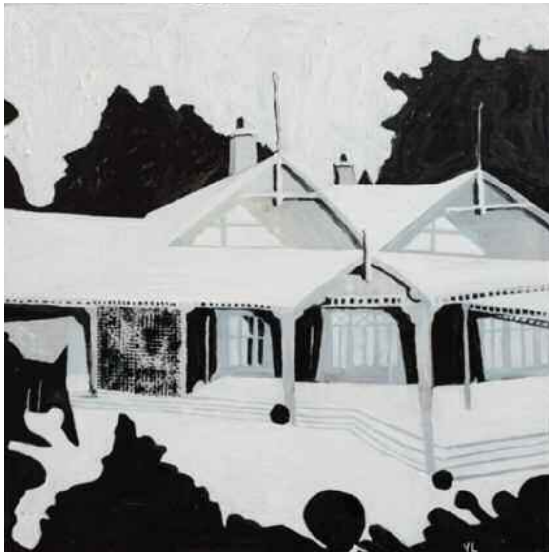
Dogwood I 43x43, olja 2008